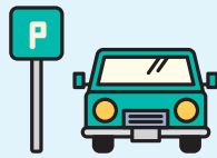
駐車場として利用したい