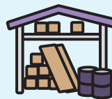
資材置場にしたい

相続登記されていない農地が社会問題化しています。相続の際は、農業委員会への届け出をお忘れなく!