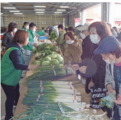
新鮮な地場産品を販売

さらに、農業用機械が見学できる「はたらくくるま展示」やタマネギの詰め放題、地産地消スタンプラリーなど、家族みんなで楽しめるイベントが用意され、訪れた約1万4千人が、秋の味覚と催しを楽しみました。