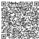
柏崎市選挙管理委員会 HP

市ホームページや市公式X(エックス)、フェイスブックで混雑状況や混雑予想をタイムリーにお知らせします。ご来場前にご覧ください。