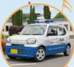
青色回転灯装備車