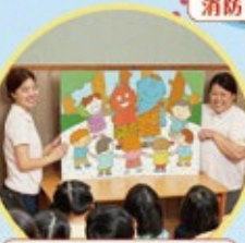
宝くじドリームジャンボ絵本

宝くじは、少子高齢化対策、災害対策、 公園整備、教育及び社会福祉施設の 建設改修などに使われています。