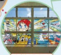
パブリックアート