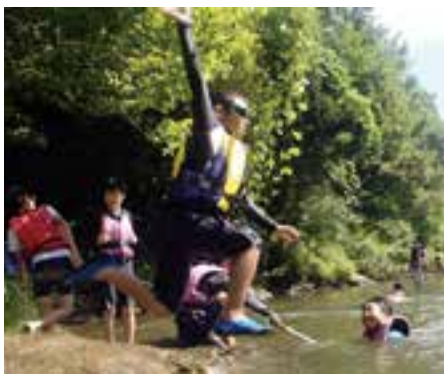
図 こども自然王国