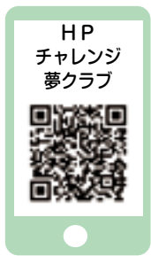
図 NPO法人チャレンジ夢クラブ