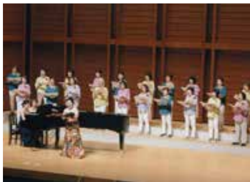
コーラス枇杷の実(横田)