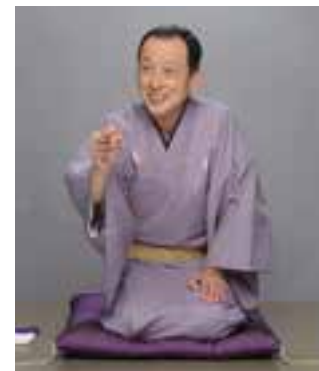
人権啓発・男女共同参画室