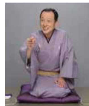
人権啓発・男女共同参画室