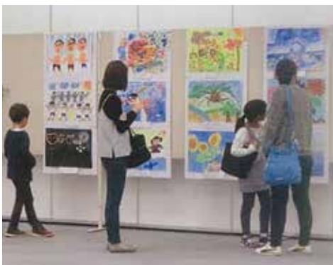
MOA美術館柏崎児童作品展 実行委員会事務局