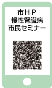
市HP 慢性腎臓病 市民セミナー