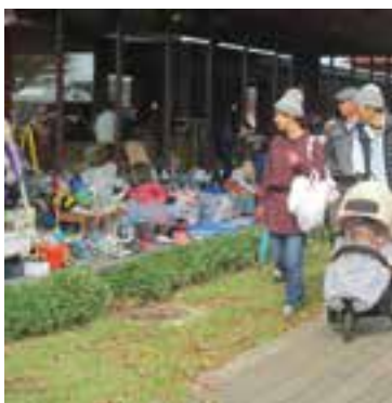
圃文化会館アルフォーレ