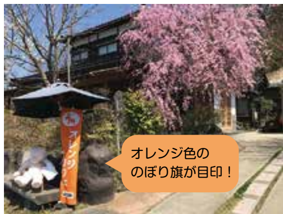
オレンジ色の のぼり旗が目印！

オレンジカフェは、認知症の方、介護をしている方、地域の方や高齢の方など、どなたでも自由に参加でき、お茶やお話を楽しみながら、気軽に介護や認知症のことを専門家に相談できる集いの場です。「認知症や介護のことを相談したい」「同じような悩みを持つ人同士で話をしてみたい」そんなときはオレンジカフェに足を運んでみましょう。