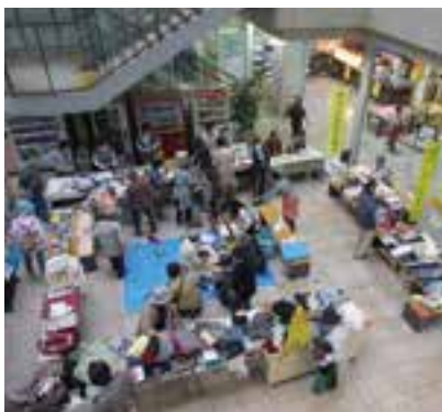
閩消費者協会事務局(市民活動支援課内)

▼受付品目：贈答品、新品またはクリーニング済みの衣料品・せともの・日用品 ※電気製品、生ものを除く。