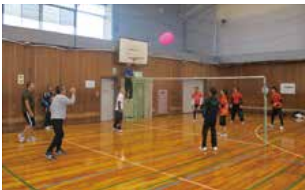
図入スポーツ振興課