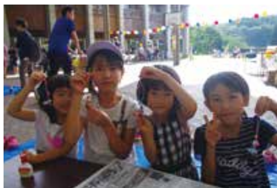
閩子ども自然王国