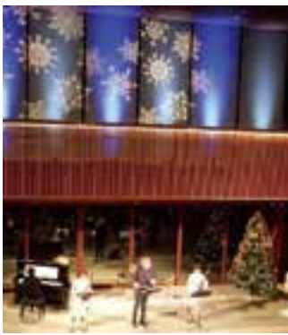
文化会館アルフォーレ

(〒945-0054日石町4-32)へ。 ※申込書は文化会館アルフォーレにあります。