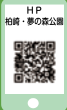
HP 柏崎・夢の森公園