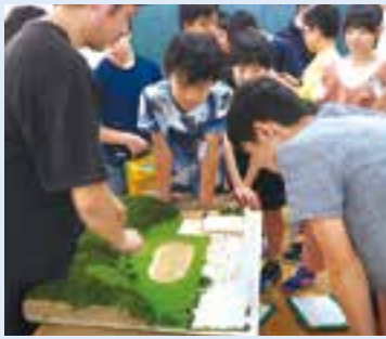
年に一回の「出前授業」。街づくりの基礎を学びながら、真剣な表情でアイデアを出し合う新道小学校の6年生の皆さん

うつくるか。そこに市民が関わる ことが、柏崎が抱える課題・問題の 解決に繋がると考えています。 市外にはなりませんが、新潟市の 「沼垂テラス」はいい例であり、と ても興味がありますね。