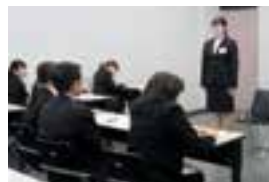
個人模擬面接の様子

12月14日(土)、「グループディスカッション」、「電話マナー実践演習」、「個人模擬面接」、「就職活動体験談を聞く」という実践的な内容の「就職活動集中対策講座」を開催しました。