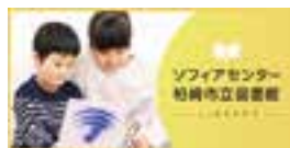
柏崎市立図書館 ソフィアセンター