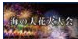
ぎおん柏崎まつり 海の大花火大会