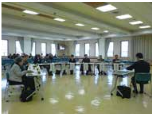
▶ 昨年の意見交換会の様子