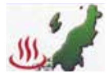
▲今回はこのラベルを貼りました

集めた資料の中から、貸し出しできる本には特設コーナー用のラベルを貼ります。あわせて、本のデータベースのうち、本棚の場所を特設コーナーに一時的に変更します。この作業をすることで、本が特設コーナーにあることを蔵書検索に反映でき、本を戻すときにも特設コーナーに戻せばよいとわかります。