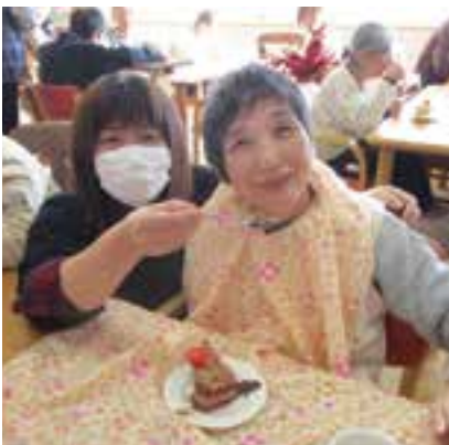
▲クリスマス会でのおやつ時の介助場面