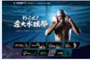
(写真上) 産大水球部のホームページ