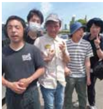
▲えんま市に出掛けた時のひとコマ