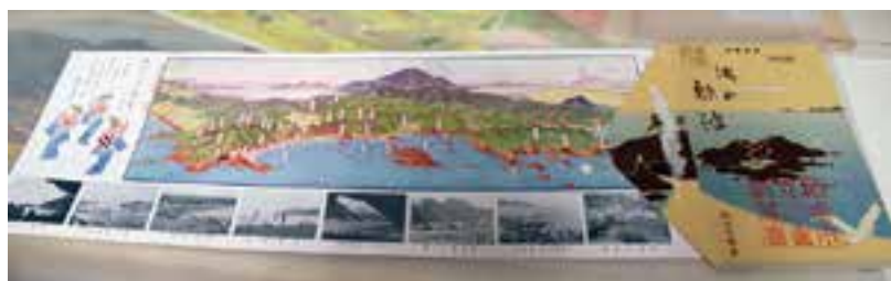
▲鉱泉浴場（鯨波温泉）が描かれている鳥瞰図「海の鯨波」昭和9（1934）年発行