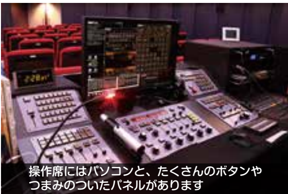
操作席にはパソコンと、たくさんのボタンやつまみのついたパネルがあります

プラネタリウム室の一番奥にある操作席で、主にパソコンを使って操作しています。星を出すのもボタンを押すだけ…ですが、そのために「ボタンを押したらこうなりますよ」という指示（スクリプト）を作って、設定しておく必要があります。つまり、プログラミングのようなことをしているのです！