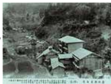
▲広田鉱泉（北条）の絵はがきを発見