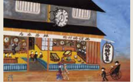
▲今昔阪神商家之図

代表的なものに『今昔阪神商家之図』があります。文明開化期の阪神の商家を、泥絵風に油彩で描いた作品です。商家の図は、川上の好きな画風であったため、同様の絵が他にも制作されています。