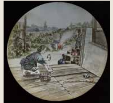
▲虎列刺病 消毒法の圖

明治の初めから昭和30年代まで日本全国で広く上映され親しまれた幻灯は、残念なことにテレビが普及すると姿を消しました。現存する幻灯板は少なく、当時の日本の様子を映すものは貴重です。所蔵品には、幕末から明治初めに世界中で大流行したコレラ（虎列刺）の予防法を知らせるものもあります。