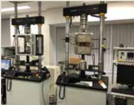
▲本文中の実験など、日頃からよく使われる材料試験機

材料力学は、一見地味で目立たない分野ですが、あらゆるものづくりの基礎であり、決して手を抜いてはならない部分です。ときには1000℃にもおよぶ高温で実験したり、数か月間24時間連続で実験を続けたりと、過酷な実験もします。また、実験装置を学生とともに自分たちの手で作ったこともあるように、様々な機械の仕組みを知り尽くせるところも魅力的だと語ります。身の回りのあらゆる