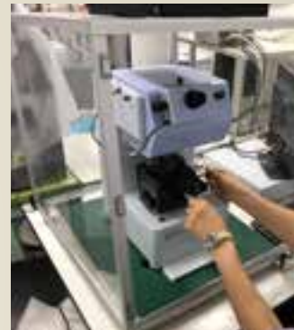
▲ダイヤモンドで材料に窪みを付けて、その大きさから硬さを調べる装置

そして多くの人に喜んでもらえるように、今日も真面目で熱心な学生に囲まれて、楽しく研究に取り組んでいます。