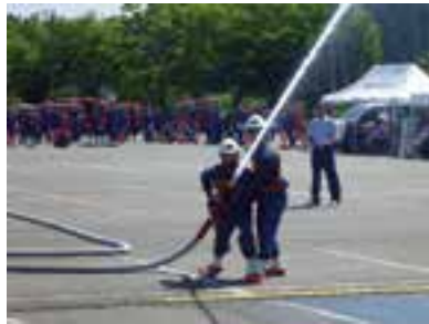
▲ポンプ操法競技会