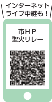
インターネットライブ中継も!