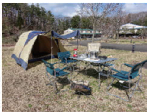
西山自然体験交流施設 ゆづぎ