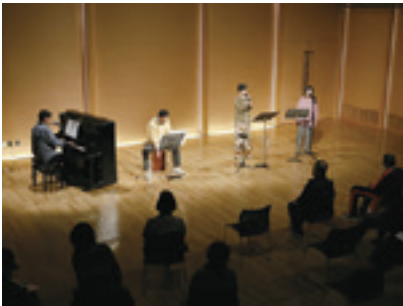
閩文化会館アルフォーレ TEL 21-0010 FAX 21-0011