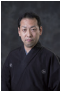
文化会館アルフォーレ TEL 21-0010 FAX 21-0011