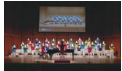
閩柏崎市民合唱団(関矢) TEL 21-4516

▶プレイガイド…文化会館アルフォーレ、産業文化会館、わたじん楽器ララフィ、石川薬局本店