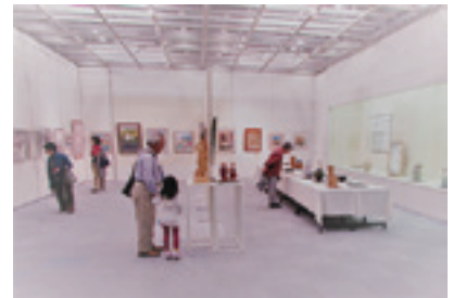
岡文化・生涯学習課 TEL 20-7500 FAX 22-2637