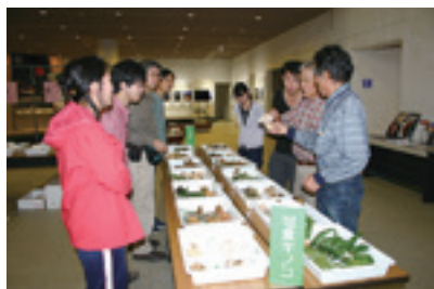
☎博物館 TEL 22-0567 FAX 22-0568