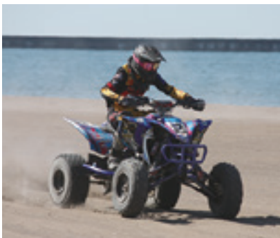
☎かしわざきオフロードスポーツ協議会 TEL 22-0201 FAX 23-0272