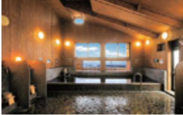
岡大崎温泉雪割草の湯 TEL・FAX 47-2113