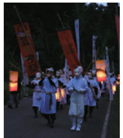
☎高柳町事務所 TEL 41-2233 FAX 41-2235