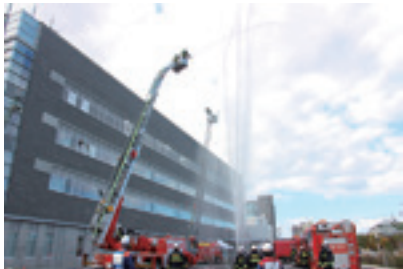
区消防署 TEL 24-1500 FAX 24-1119