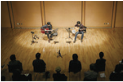
文化会館アルフォーレ TEL 21-0010 FAX 21-0011