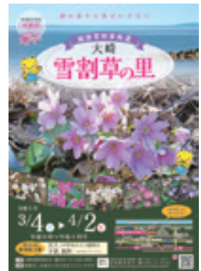
関大崎雪割草保存会