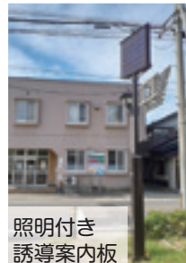
照明付き誘導案内板