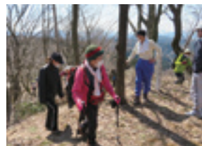
☎中通コミセン TEL28-2002 FAX28-2003