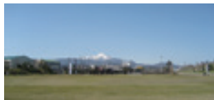
広～い芝生でストレッチ