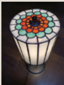
▲花のテーブルランプ

県内の作家たちによる、ランプ、 あんどん 行灯、皿、スタンドグラス、フュージングやパート・ド・ヴェールなどの工法を用いたガラス工芸の作品を展示します。