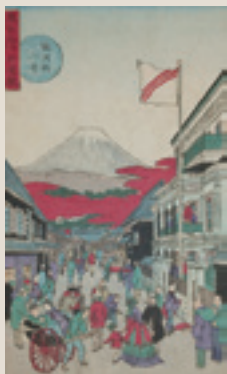
するがちよう みつい ▲駿河街 三井

東京絵は、明治の新しい世相や風俗などを描き出した開化絵です。横浜絵が異国人や異国の風俗習慣を写すのに対して、東京絵は洋風の建物や洋装の日本人など、文明開化の日本の様子を写しています。