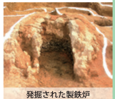
発掘された製鉄炉