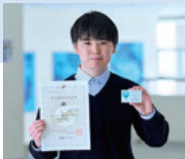
将来を考える第一歩として、在学中にさまざまな資格を取得

就職後、皆さんの会社のお手伝いをする機会があるかも知れません。その際はよろしくお願ひします。