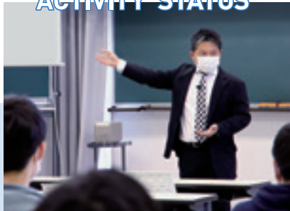
学生に実践的な英語を講義