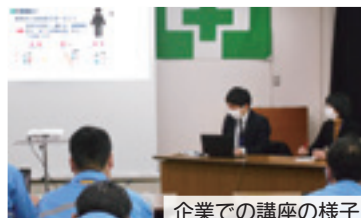
企業での講座の様子