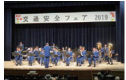
関市民活動支援課