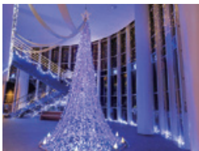
西山ふるさと公苑

②音楽ライブ・キッチンカー 12月9日(土)～10日(日)18:00～20:00