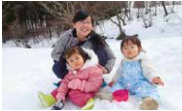
園 柏崎・夢の森公園 TEL 23-5214 FAX 23-5113