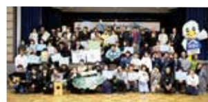
昨年の「柏崎冬のフェスティバル」