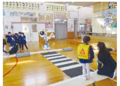
図 市民活動支援課