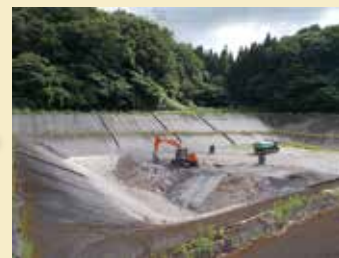
▲夏渡の最終処分場