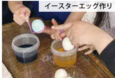
イースターエッグ作り

▶申し込み…3月6日(金)までに二次元コードから、または直接・Eメール(住所・氏名・小学校名・学年・日中に連絡可能な電話番号・メールアドレス・アレルギーの有無を記入)