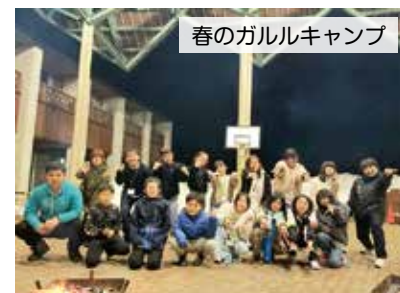
春のガルルキャンプ