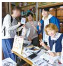
えんま市でポストカードを販売

では、日本文化の一つとして留学生や柏崎市内に住むさまざまな国の方々に向けた書道体験会を実施しました。また、えんま市ではポストカードの販売を行うなど、市内各地で幅広い活動を展開しています。