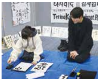
国際交流イベントでのパフォーマンス