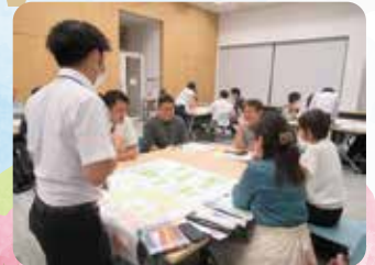
▲市民ワークショップの様子