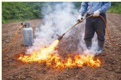
▲土壌焼却や殺虫も処罰の対象です