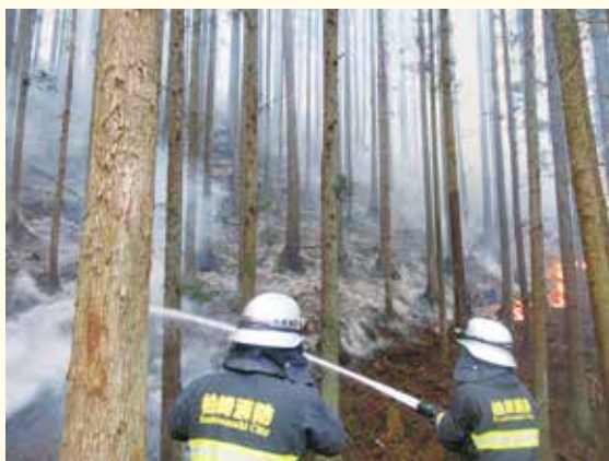
▲岩手県大船渡市で消防活動にあたる、 柏崎市消防職員(令和7(2025)年3月撮影)

令和 7 (2025) 年 2 月に岩手県大船渡市で発生した林野火災は、鎮火までに 1 カ月以上かかりました。約 3,370 ヘクタールが焼け、1 人が亡くなり、226 棟の建物に被害をもたらしました。