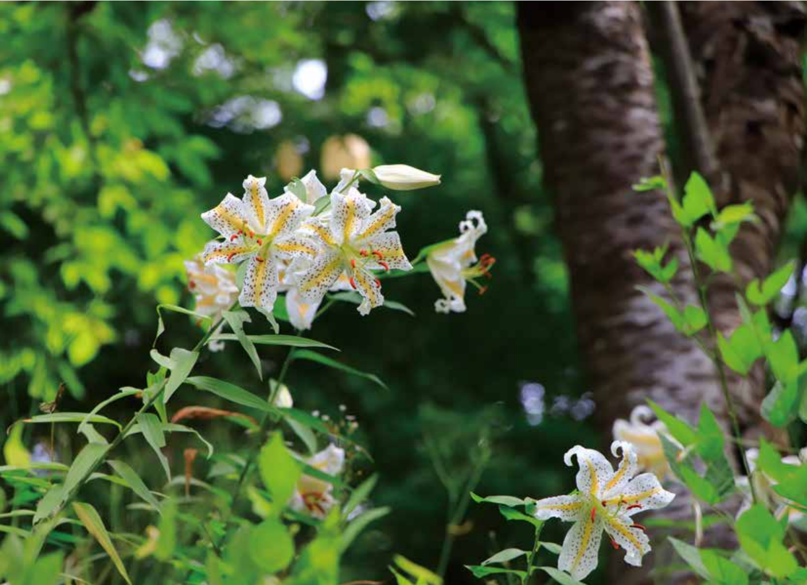
写真：赤坂山公園のヤマユリ