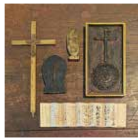
▶潜伏キリシタン信仰具

潜伏キリシタンの信仰具と、当館収集家が暮らしの中で大切に使い愛でたものを展示します。