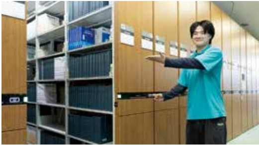
オープンキャンパスでは、学生スタッフがキャンパスを案内します

や設備を実際に見ることができる貴重な機会です。しかし、それ以上に大切なのは、その大学に通う学生たちの雰囲気を感じられることだと思います。オープンキャンパスに参加した際は、どんな小さなことでも先輩学生に質問してみてください」