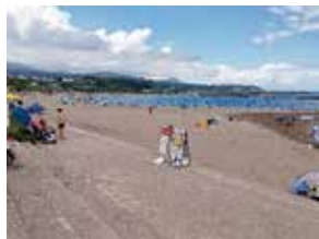
令和 7(2025)年 8月 2 日(土)の 番神海水浴場

夏、私の願い。熱中症に気を付けながら、柏崎の子どもは海、山、川で遊んでもらいたい。お父さん、お母さん、おじいちゃん、おばあちゃん、お願いします。