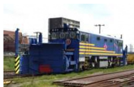
投排雪保守用車の展示