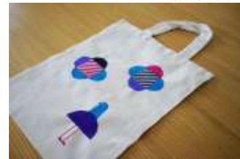
オリジナルエコバッグ(イメージ)