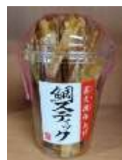
柏崎地場産品（鯛スティック、網代焼）