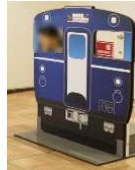
『越乃 Shu * Kura』の顔出しパネル