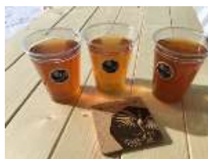
柏崎産小麦を使ったクラフトビール