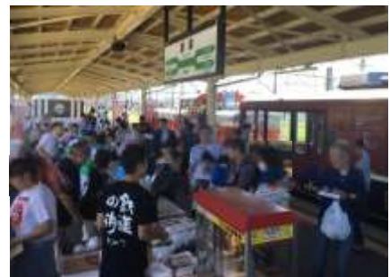
新津駅のイベント開催時風景