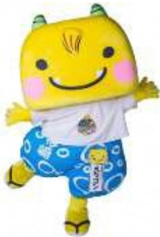
柏崎市のご当地キャラクター『えちゴン』