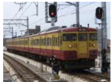
115系車両（懐かしの新潟色）