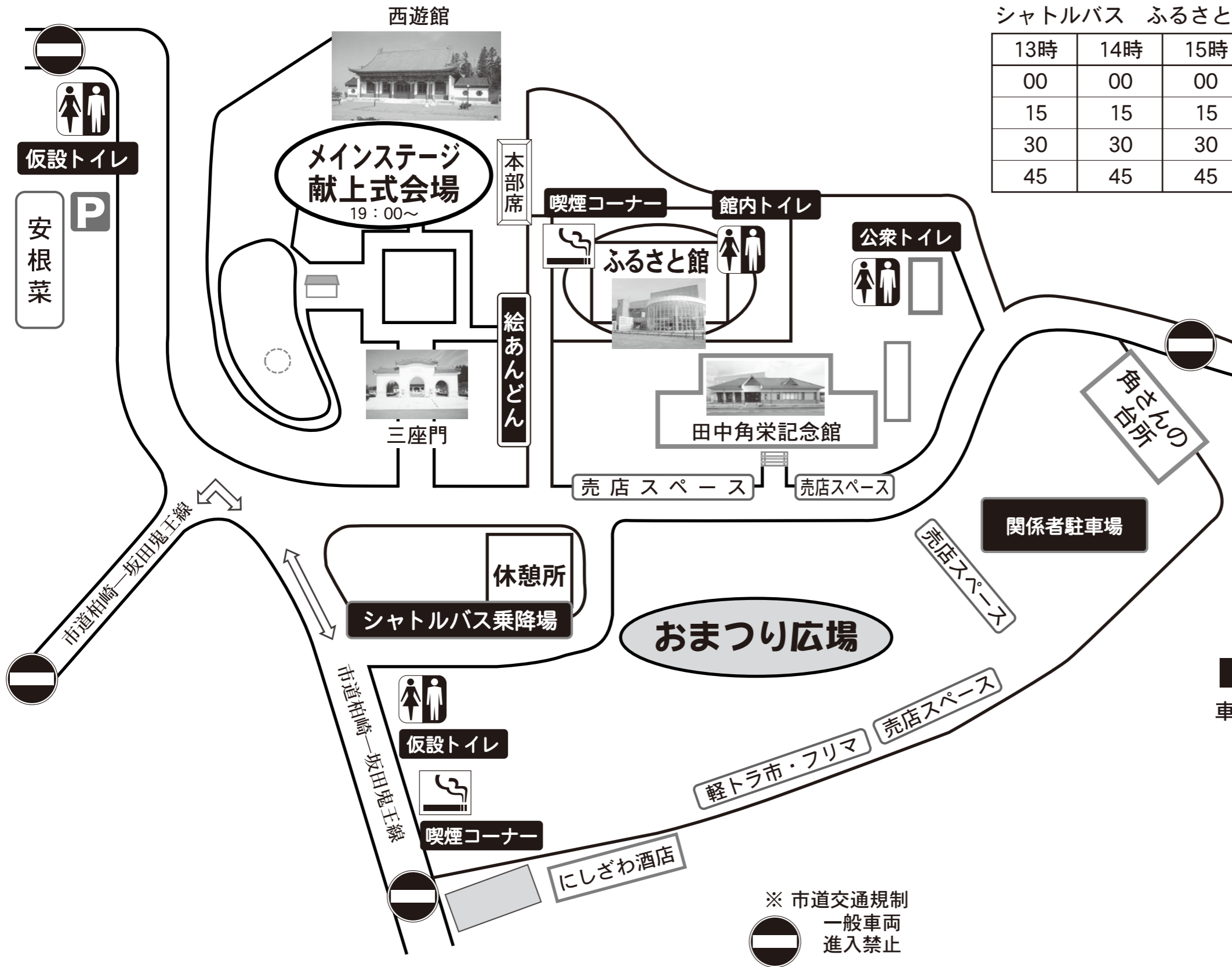
シャトルバス ふるさと公苑発車時刻

※ふるさと公苑付近は大変混み合うことが予想されます。駐車スペースが少ないので車で来場される方はなるべく乗り合わせておいていただくか、シャトルバスをご利用ください。