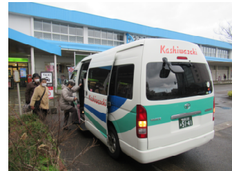
地域主体で運行している 米山地区乗合タクシー

高齢化の進行などから、市民の方々の地域公共交通への関心の高まりを受け開催します。