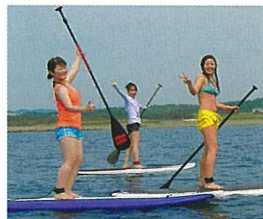
みんなでワイワイ海上散歩【サップ】