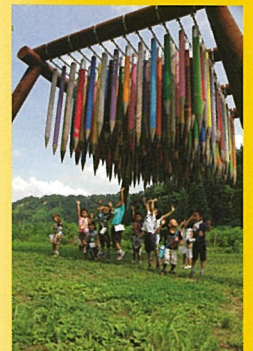
バスカル・マルティン・タイユー 「リバース・シティー」