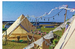
安心で美しいビーチ【旅するテント】