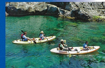
透明度抜群の海【シーカヤック】