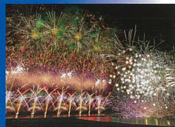
大迫力・豪華絢爛【7.26 海の大花火大会】