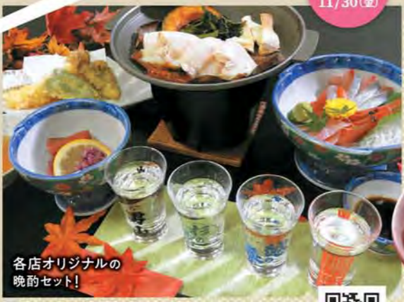
各店オリジナルの 晩酌セット!

TEL.0257-22-4910 http://www.nfcnet.co.jp/