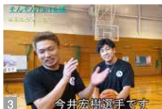
1 バスケ指導で地域の子どもたちの技術アップ 2 Rykohsのアイテム・フリーストパーカー 3 YouTubeで1on1対決