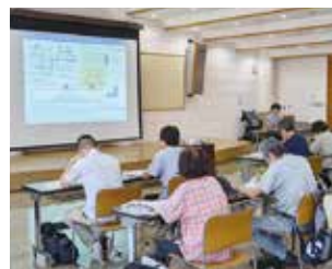
(写真右) 原子力防災講座の様子(妙高市新井総合コミュニティセンター)