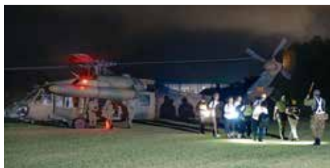
(写真左) 夜間航空機避難訓練の様子(鯖石川改修記念公園)

今後も、さまざまな事態を想定した訓練を行い、万が一の原子力災害に備えていきます。