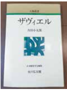
『ザヴィエル』 著者：吉田 小五郎 編集：日本歴史学会 出版社：吉川弘文館

私はキリスト教徒ではないが、プレゼントもケーキも大好きだ。だが、子どもたちも妻も成人、超人し、もう何年もクリスマスプレゼントを贈っていない。さすが神が保たれている町？神保町、「悔い改めよ」と妻の声が聞こえたようだ、空耳であったと信じている。