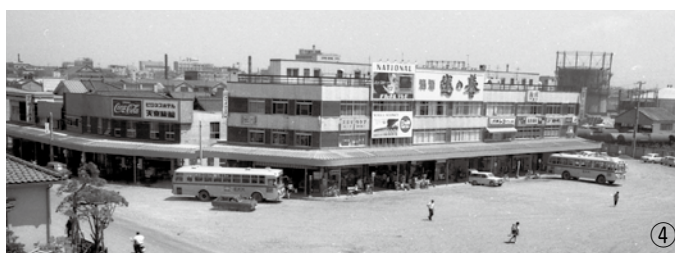
①昭和 41 (1966) 年産業会館竣工 (本町通り) ②昭和 41 (1966) 年婦人会のユースホステル見学 ③昭和 45 (1970) 年綾子舞現地公開 (黒姫神社境内) ④昭和 45 (1970) 年の柏崎駅前