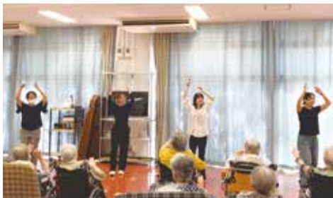
むつみ荘では利用者の皆さんと一緒に楽しみました