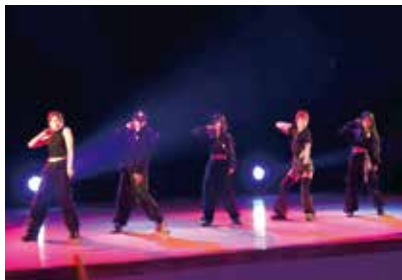
紅葉祭(学園祭)で披露したダンスパフォーマンス

新しいことに挑戦する楽しさを感じながら、練習に励んでいます。ダンスで地域を明るくしたいと思っていますので、応援よろしくお願いします!