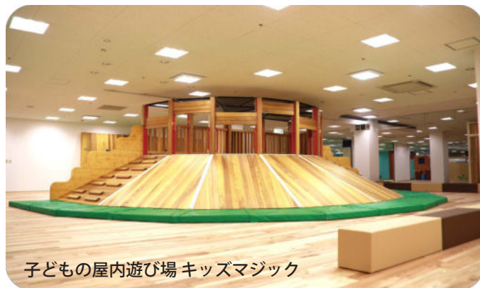
子どもの屋内遊び場 キッズマジック